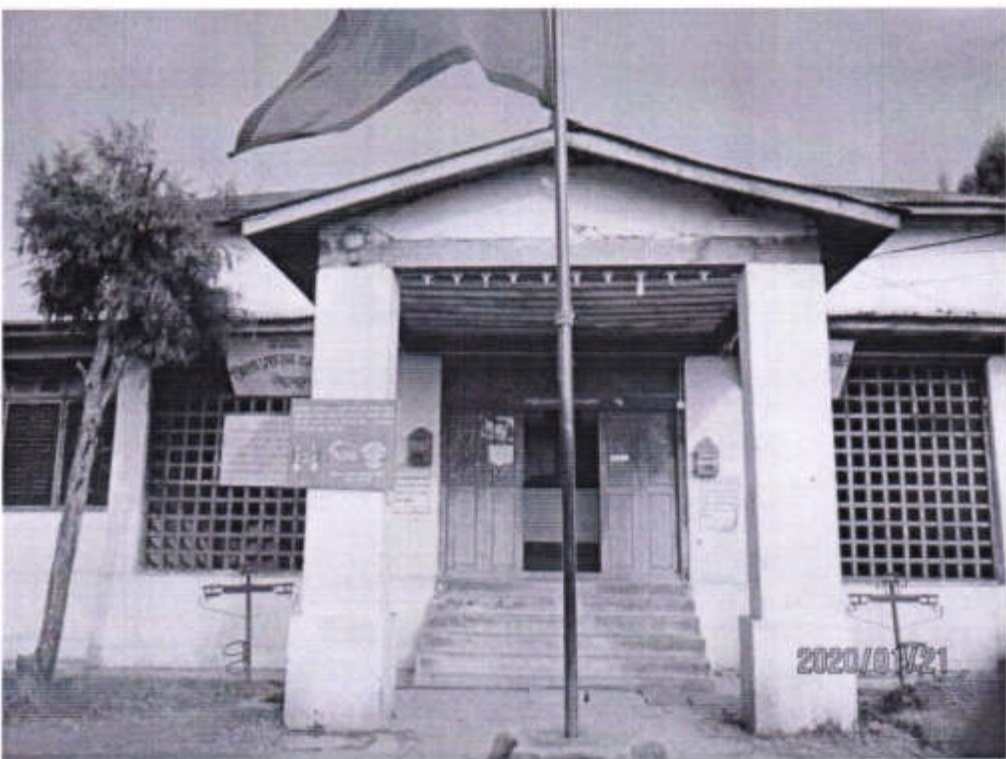
जिल्ला प्रशासन कार्यालय भवन