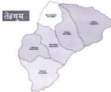
तेह्रथुम जिल्लाको राजनैतिक विभाजन

जनसंख्याको अवस्था: लिम्बु (३५%), क्षेत्री (१९%), ब्राम्हण (१६%), अन्य जातजाती (३०%) बसोबास रहेको यस जिल्लामा नेपाली भाषी ५२.९%, लिम्बु भाषी ३२.७७% र अन्य १४.३३% भाषाभाषीको बसोबास रहेको