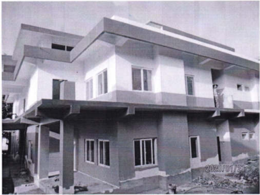
जिल्ला प्रशासन कार्यालय, तेह्रथुमको निर्माणाधिन भवन